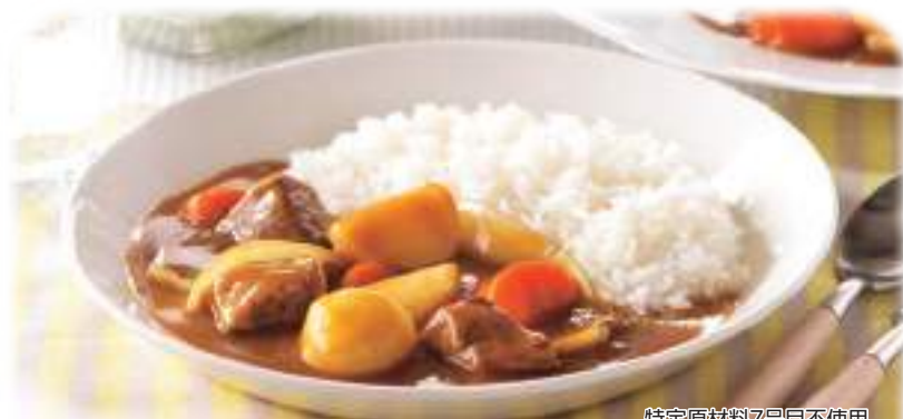
特定原材料7品目不使用 バーモントカレー 〈中辛〉調理例