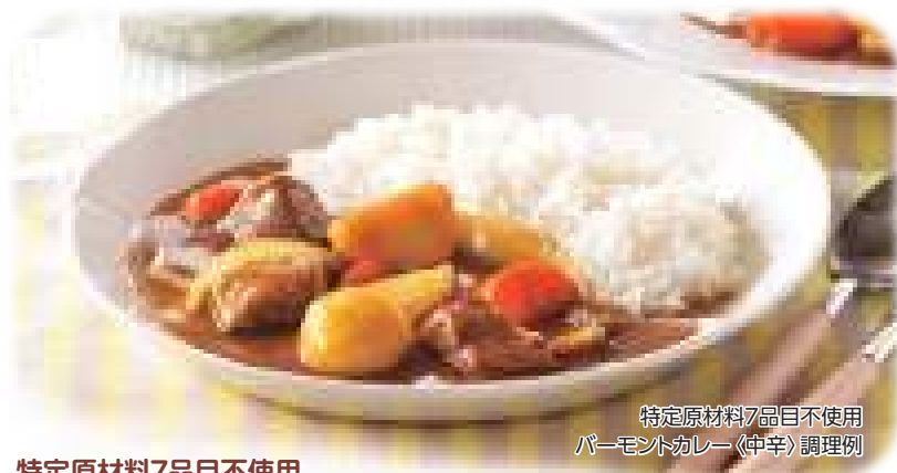
特定原材料7品目不使用 バーモントカレー〈中辛〉調理例